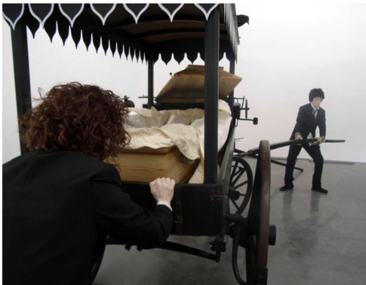
Dead Man Walking Installation Photographée ici au FRAC Languedoc-Roussillon pour son exposition d'été 2011 « Go to Thy Cold Bed and Warm Thee »