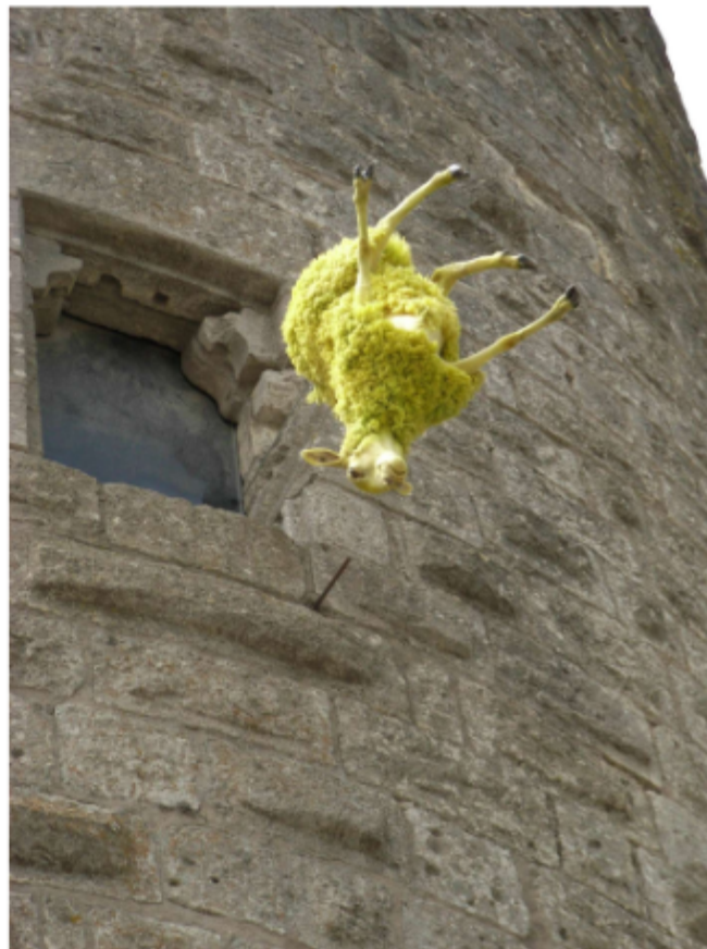
Casting- Installation Dans le cadre de la « Dégelée Rabelais » été 2008 organisé par la Région et le FRAC Languedoc-Roussillon Quatre brebis naturalisées et colorées semblent sauter des remparts d'Aigues-Mortes...