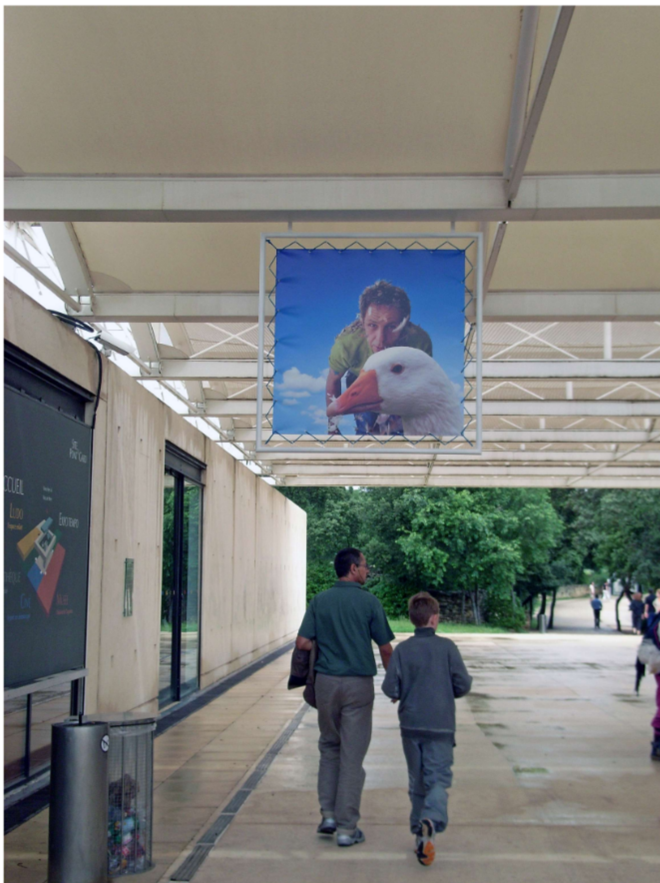
Vue des signalétiques Fight au Pont du Gard pour l'exposition La dégelée Rabelais - été 2008 - Région et FRAC Languedoc-Roussillon