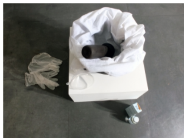
Cueillette et filtrage du jus des feuilles, tiges, fruits, et fleurs