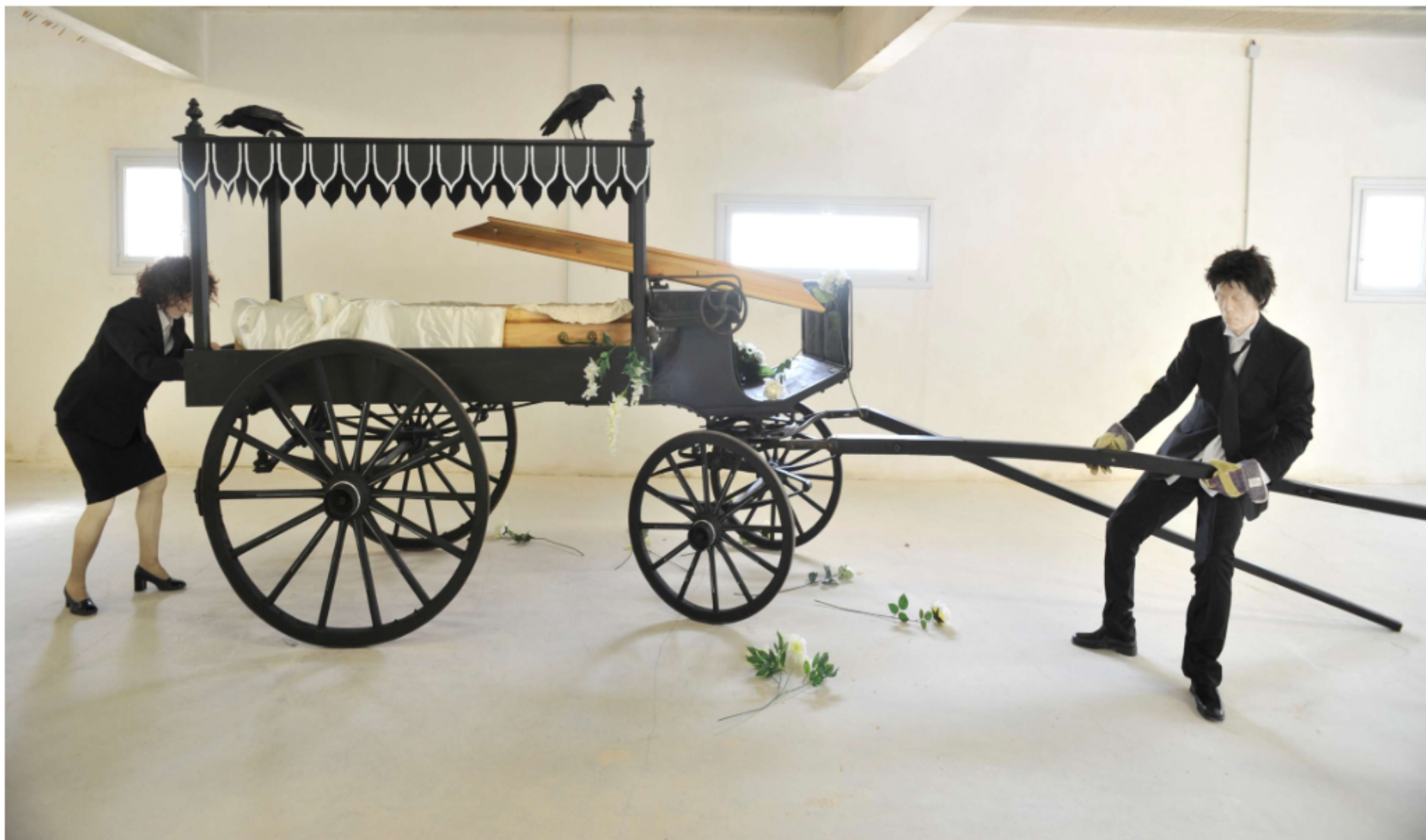
Dead Man Walking Installation Photo atelier – Dim 8 m x 2 m x 2.30 m de hauteur Collection du FRAC Languedoc-Roussillon 2010