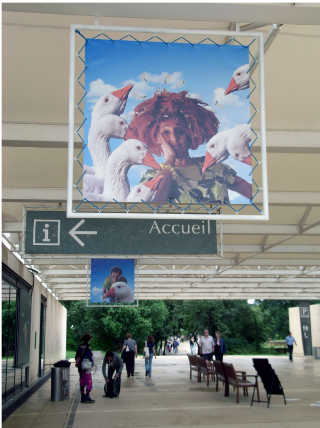
Vue des signalétiques Fight au Pont du Gard pour l'exposition La dégelée Rabelais - été 2008 - Région et FRAC Languedoc-Roussillon