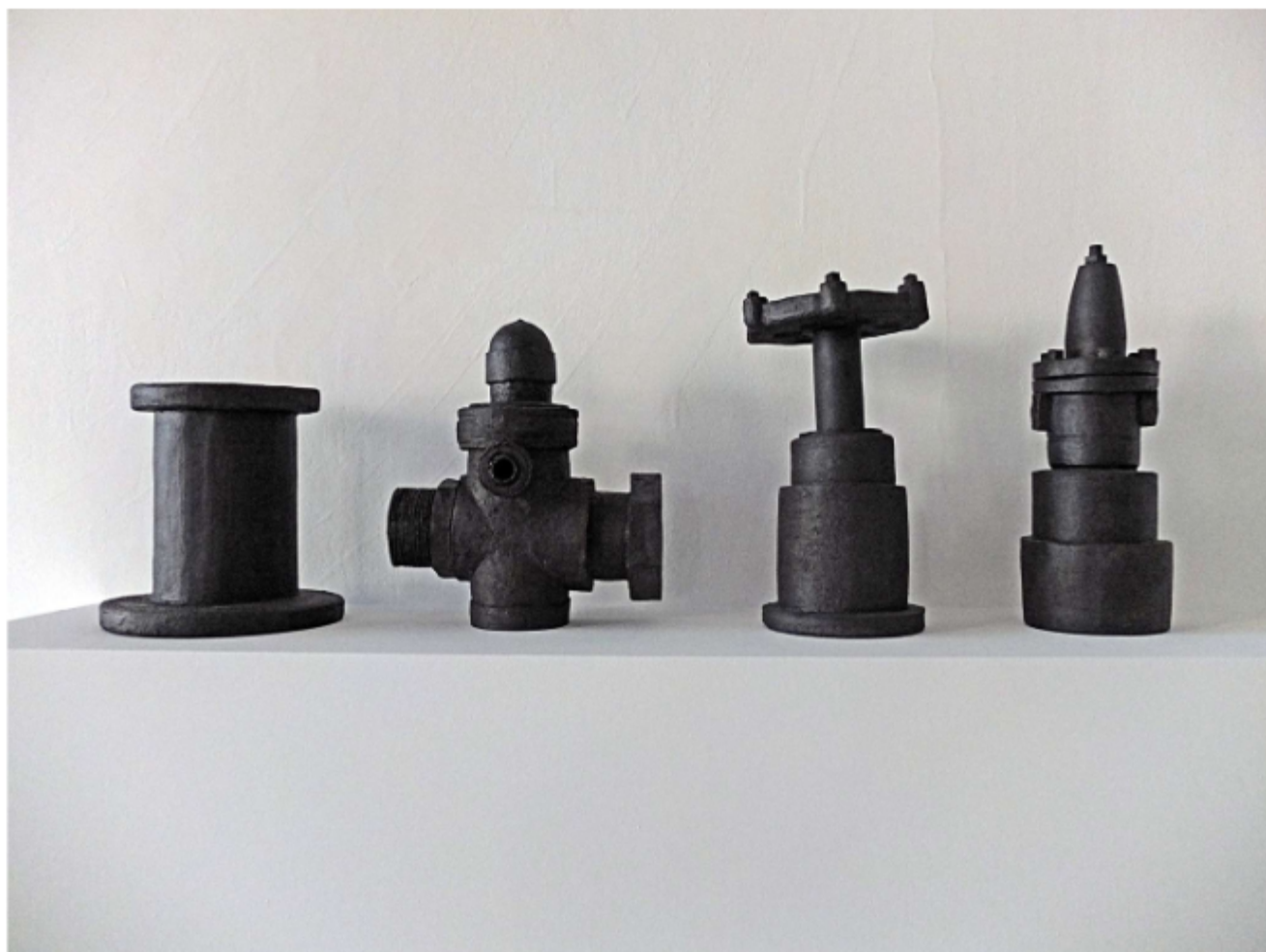
Regard – Régulateur de pression – Vanne à volants – Réducteur de pression Céramique - Grès noir Dimension : 100 cm x 55 cm