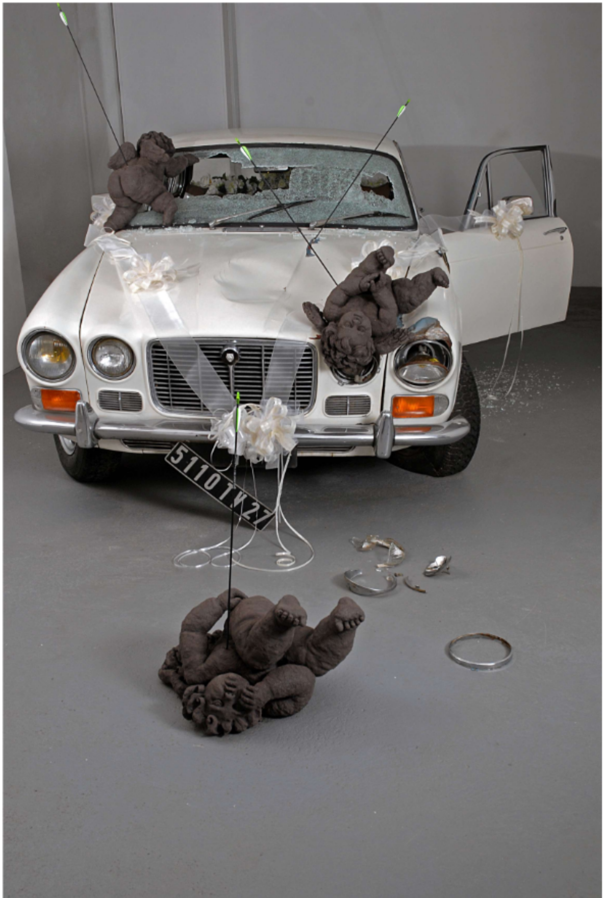
Just a crash - Installation Exposition « Des anges » - galerie ESCA au PPCM / Nîmes Janvier-février 2009 Jaguar + décorations synthétiques + Angelots en terre crue + flèches Décathlon