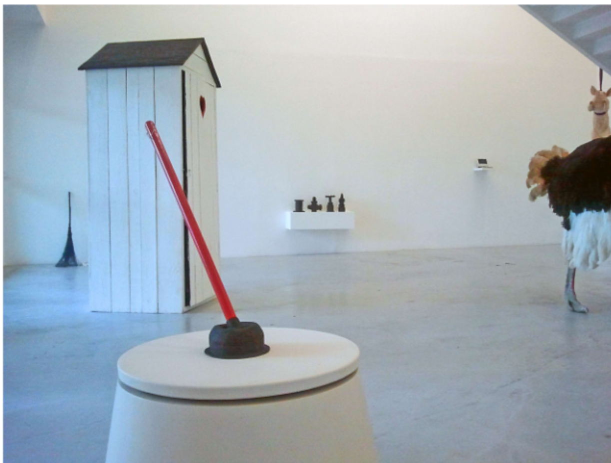
Vue générale de l'exposition HEM HEM, avec au premier plan un "Dégorgeoir" céramique et bois sur socle tournant