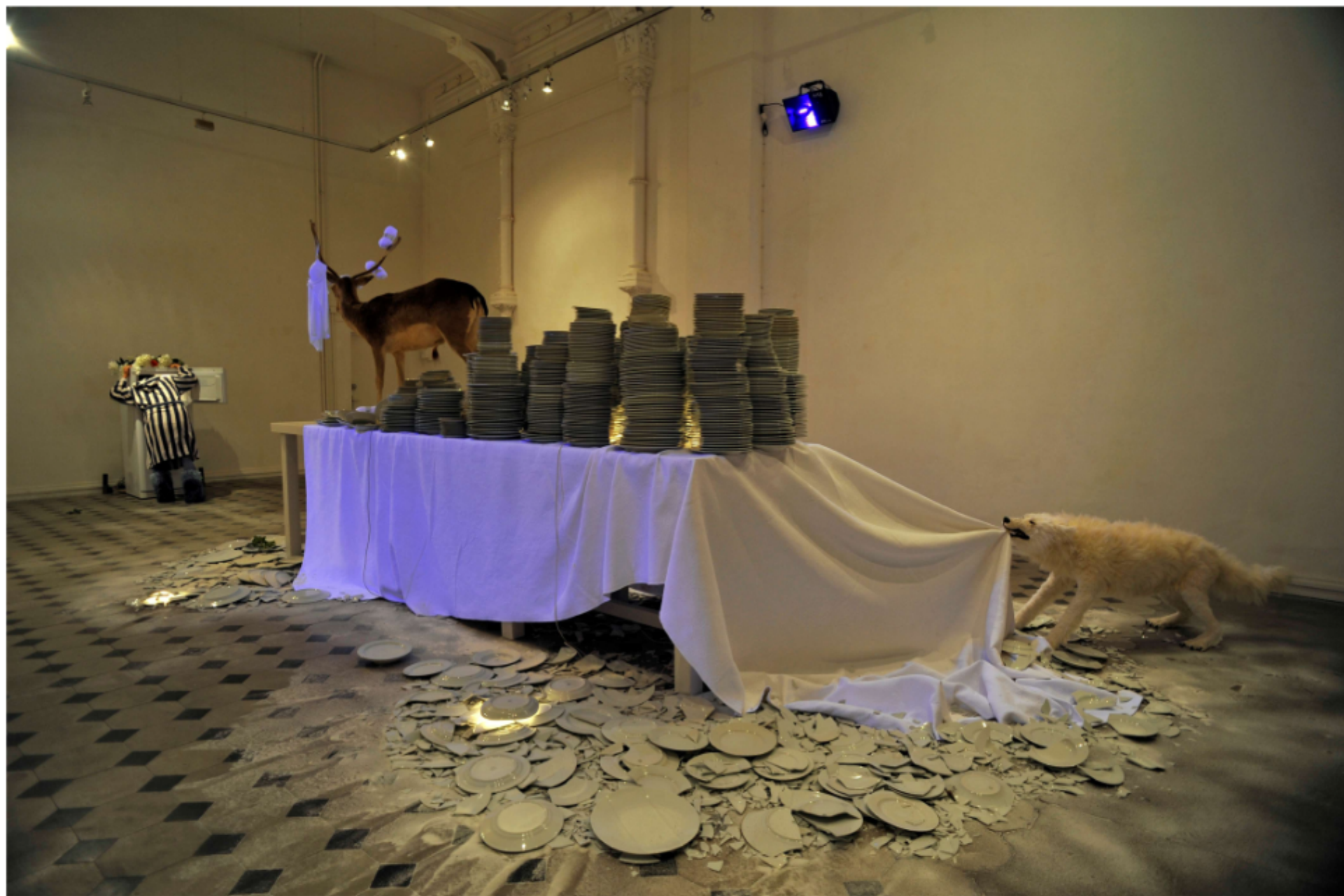
Nouritures terrestres / Installation sur 80 m 2 La Salamandre en 2010, dans le cadre du Festival DESSENS organisé par la Région Languedoc-Roussillon et Le Manif dans la ville de Nîmes